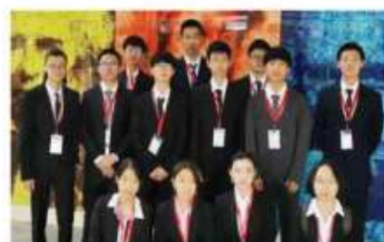
英国奥林匹克数理化学竞赛 金银铜牌20枚