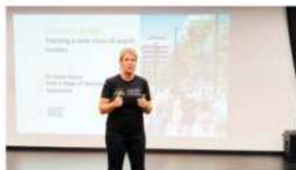
澳大利亚国立大学 (2024 QS排名#34)