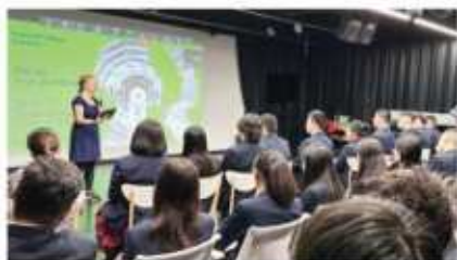
帝国理工学院 (2024 QS排名#6)