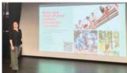
麦吉尔大学 (2024 QS#30)