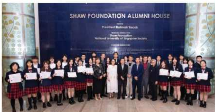
新加坡国立大学商学院合作项目

此外，学校还长期举办多种多样的国际学生领导力活动、社区义工活动及跨国公益活动等，并与各专业机构、俱乐部合作，积极拓展校园课外活动，丰富学生的课余生活，促进学生的个性化和多元化发展。