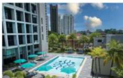
本校区诺富特公寓

辅仁校区诺富特公寓位于新加坡乌节中心地带，达尔维（男生）公寓位于新加坡黄金地段第10邮区的 Dalvey Road，哲沃思(女生)公寓则位于使馆区，靠近印尼、文莱、马来西亚大使馆的Jervois Road。