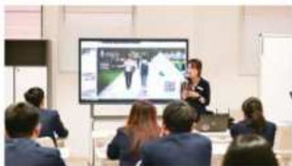
约翰·霍普金斯大学 (2024 QS排名#28)