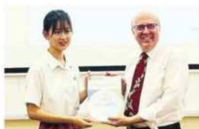
国际剑桥A-Level数学统考 全球最高分