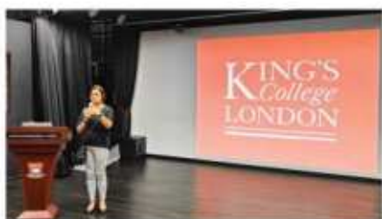
伦敦国王学院 (2024 QS排名#40)