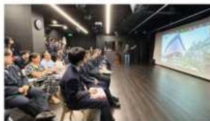
南洋理工大学 (2024 QS排名#26)