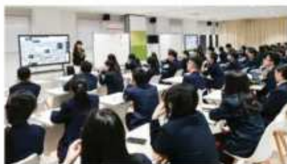
新南威尔士大学 (2024 QS排名#19)