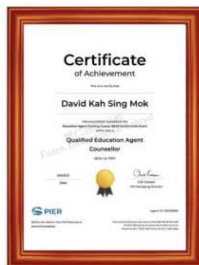
澳大利亚国际教育机构 国际认证教育代理顾问资质