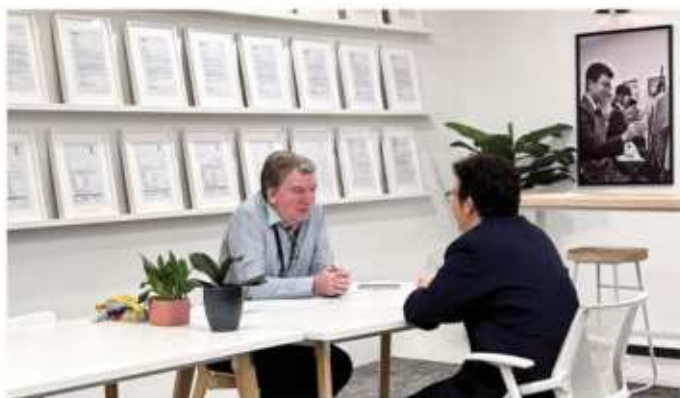
英语分级一对一口语考试