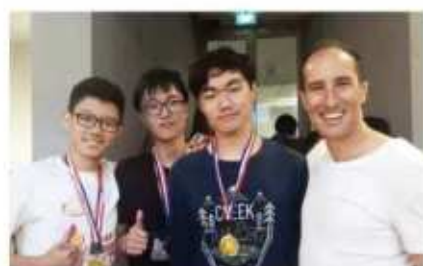
2017年亚洲学生领导力峰会金奖