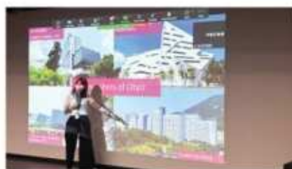
香港城市大学 (2024 QS排名#70)