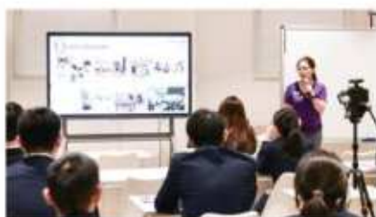
香港中文大学 (2024 QS排名#47)