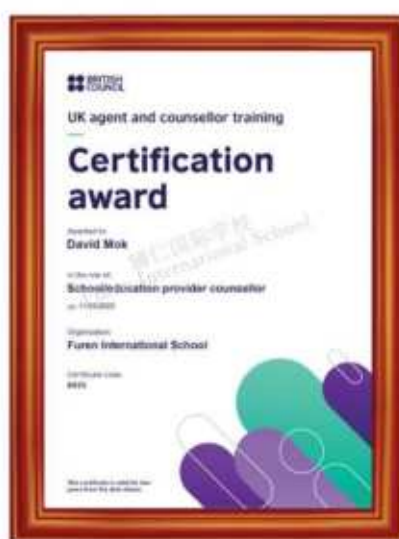
英国文化教育协会 国际认证大学招生和申请资质

辅仁具有英国文化教育协会和澳大利亚国际教育机构颁发的权威的国际认证资质，还拥有专业的校内升学规划指导团队 Guidance and Counselling Office，简称GCO，定期开设升学规划指导讲座，为学生量身定制升学规划方案，力求帮助每一位学生进入理想的专业和大学。