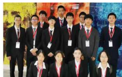
英国奥林匹克数理化学竞赛 金银铜牌20枚