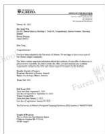
阿尔伯塔大学 人工智能专业，世界第六