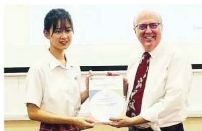
国际剑桥A-Level数学统考 全球最高分