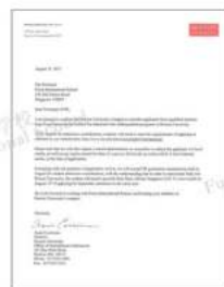
波士顿大学 世界顶尖私立大学之一