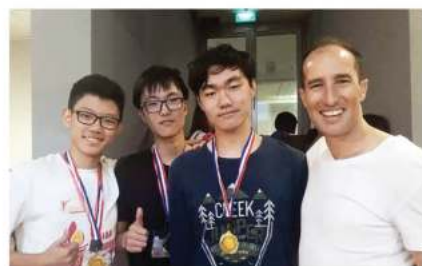
2017年亚洲学生领导力峰会金奖