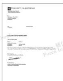
阿姆斯特丹大学 传播学及媒体研究 专业世界第一