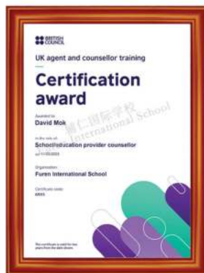
英国文化教育协会 国际认证大学招生和申请资质

辅仁具有英国文化教育协会和美国国际招生协会颁发的权威的国际认证大学招生和申请资质，还拥有专业的校内升学规划指导团队 Education Career Guidance, 简称ECG, 定期开设升学规划指导讲座，为学生量身定制升学规划方案，力求帮助每一位学生进入理想的专业和大学。