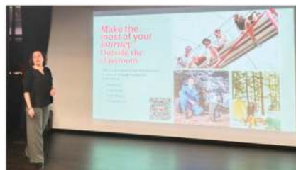
麦吉尔大学 (2024 QS排名第三十)