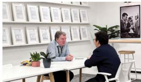
英语分级一对一口语考试