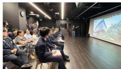
南洋理工大学 (2024 QS排名第二十六)