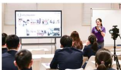
香港中文大学 (2024 QS排名第四十七)