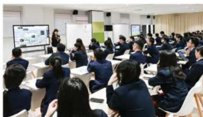
新南威尔士大学 (2024 QS排名第十九)