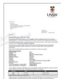
新南威尔士大学 工程学院，全澳规模最大