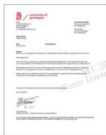
格罗宁根大学 欧洲常春藤联盟高校之一