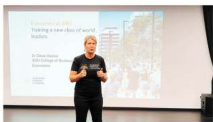
澳大利亚国立大学 (2024 QS排名第三十四)