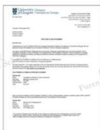
格拉斯哥大学 会计与金融、牙医、 教育学、医学，英国第一