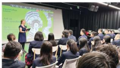
帝国理工学院 (2024 QS排名第六)