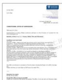
奥克兰大学 新西兰“国宝级”大学