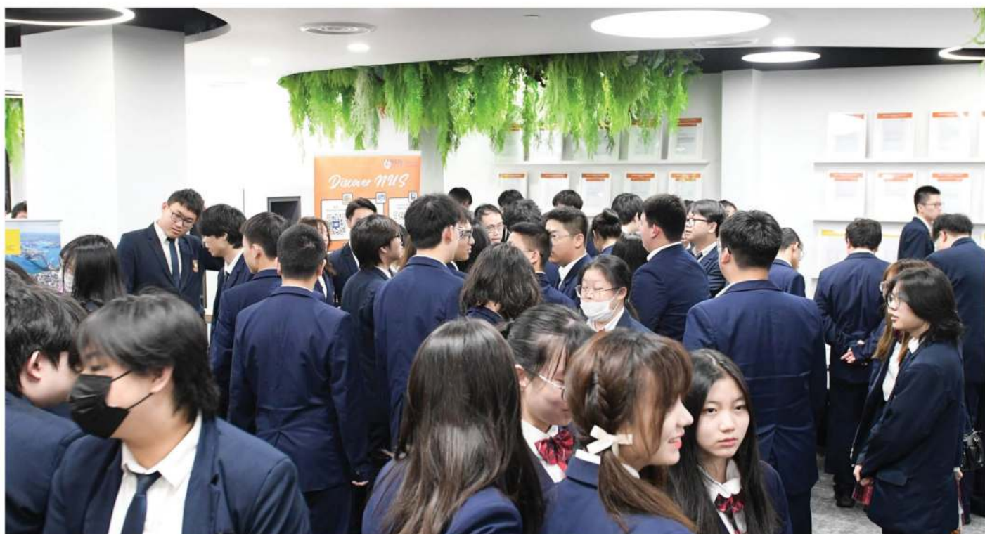
辅仁名校教育展活动

新加坡移民厅规定国际学生每月的出勤率不能低于90%，包括所有学术和活动项目安排。