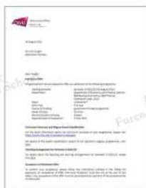
香港城市大学 电脑科学专业，全球第九， 商科，亚洲第二