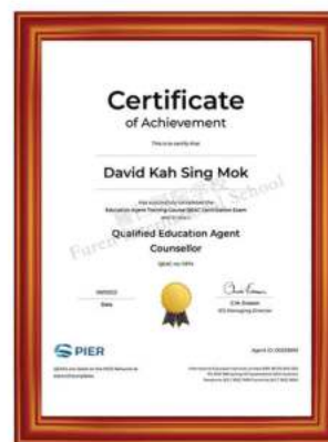
美国国际招生协会 国际认证大学招生和申请资质