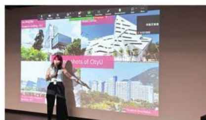
香港城市大学 (2024 QS排名第七十)