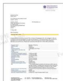
昆士兰大学 商学院，亚太第一， 全澳也获第一