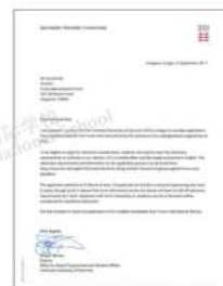
丹麦科技大学 世界顶尖工程技术类大学之一， 工程专业，欧洲第九