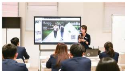
约翰·霍普金斯大学 (2024 QS排名第二十八)