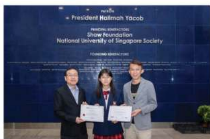
新加坡国立大学商学院合作项目